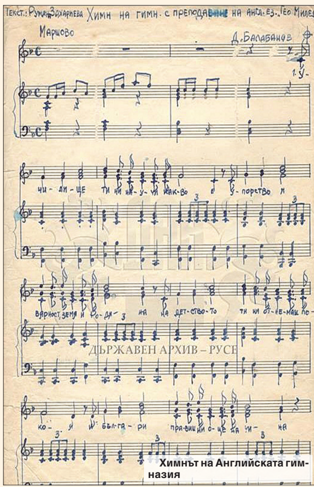
Химнът на Английската гимназия