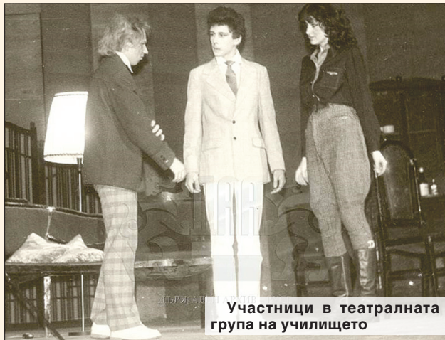
Участници в театралната група на училището