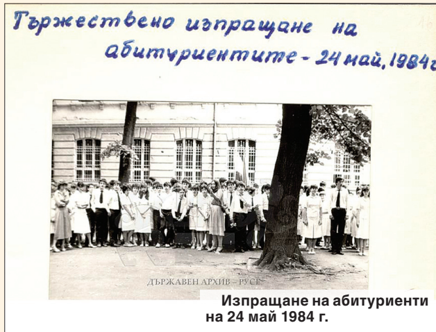
Тържествено изпращане на абитуриентите - 24 май, 1984 г.